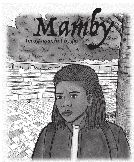
Geschreven door Mildred Luijdjens · Met illustraties van Jurno Ignacio