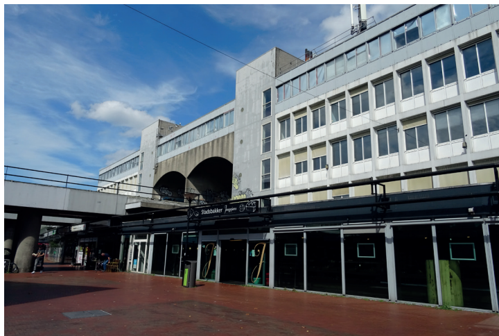
Poortgebouw over de metrolijn