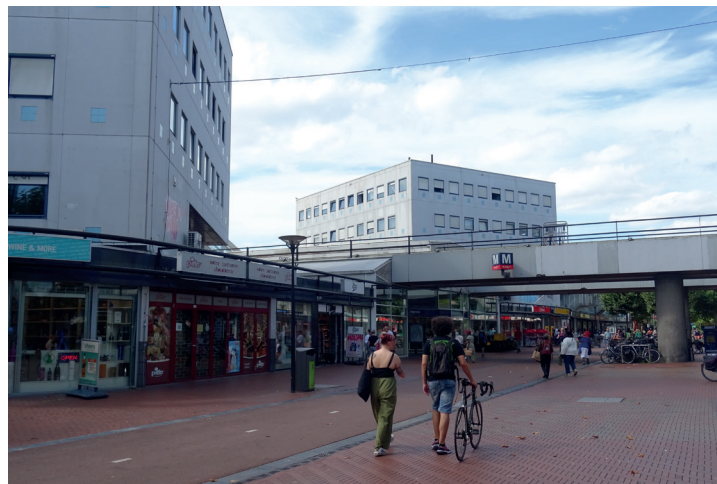
De twee kantoorstorens

Op 26 juni waren enkele bewoners van Reigersbos (betrokken bij het onderzoek over bewonersparticipatie en het bewonersplatform) te gast bij de ombudsman Amsterdam voor een gesprek over het vormgeven van de participatie van bewoners. En dat op initiatief van projectontwikkelaar REB Projects B.V. samen met de VORM Holding. De REB namens EPC Vastgoed – eigenaar van de twee kantoorstorens naast de metro, het poortgebouw over de metrolijn en de parkeergarage met benzinstation. Hieronder volgt een korte impressie van het gesprek, een eerste kennismaking tussen projectontwikkelaars en een aantal bewoners.