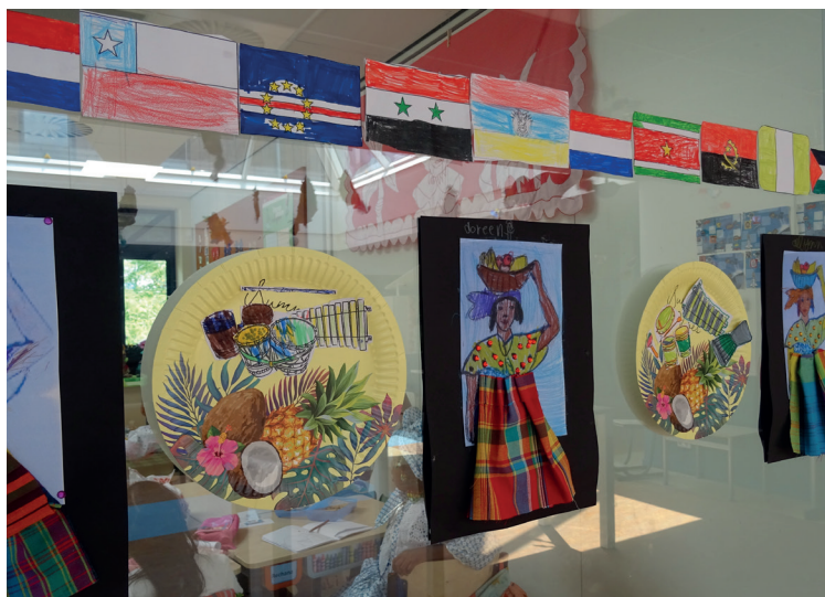
Werkstukken gemaakt door leerlingen van basisschool De Tamboerijn in het kader van de herdenking van het slavernij verleden.

Redactie Buurtkrant Reigersbos (een samenwerking tussen Bewonersplatform Reigersbos en Oba Reigersbos)