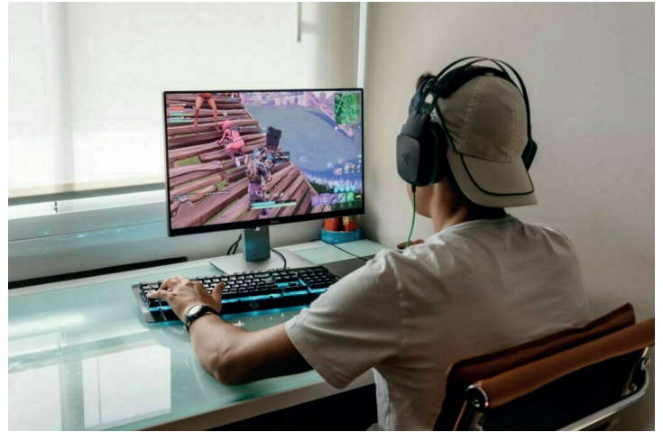
Wat maakt games zo verslavend?