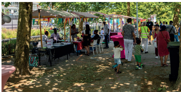
Impressie van de marktkramen en het publiek op de Gezondheidsmarkt

Door elkaar te ontmoeten is er nu een initiatief voor een gezondheidsproject voor mannen samen met de GAZO en Reigersbos Medisch Centrum. Een levendige presentatie in reanimeren krijgt mogelijk een vervolg bij de Windsurf-Sup- & Zwemvereniging Gaasperplas. Een prachtig resultaat dankzij verbinding. Hier doen wij het voor. Wie weet volgt er meer.