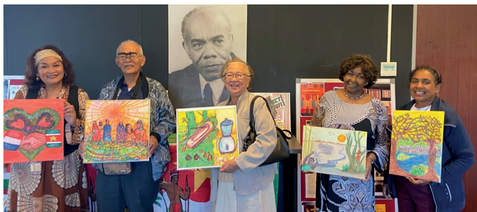
Enkele deelnemers van het Schilderijproject 'van Donker naar Licht'

Tentoonstelling is te bezichtigen in het kader van Herdenking Slavernijverleden 2023.