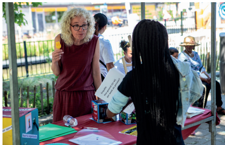
Jonge reporter heeft de vragenlijst op haar arm.

De meiden van 'Parels met een missie' hebben keihard gewerkt als jonge reporters. Zij hebben op de gezondheidsmarkt korte interviews afgenomen. Door middel van de enquêtes is een perfecte verbinding gemaakt. Zij hebben de vragen helemaal zelf bedacht, met als doel te onderzoeken hoe gezond onze leefgewoonten zijn. Enthousiast, doelgericht en gedreven zijn ze op de mensen afgelopen. Reden om trots op onze jeugd te zijn.