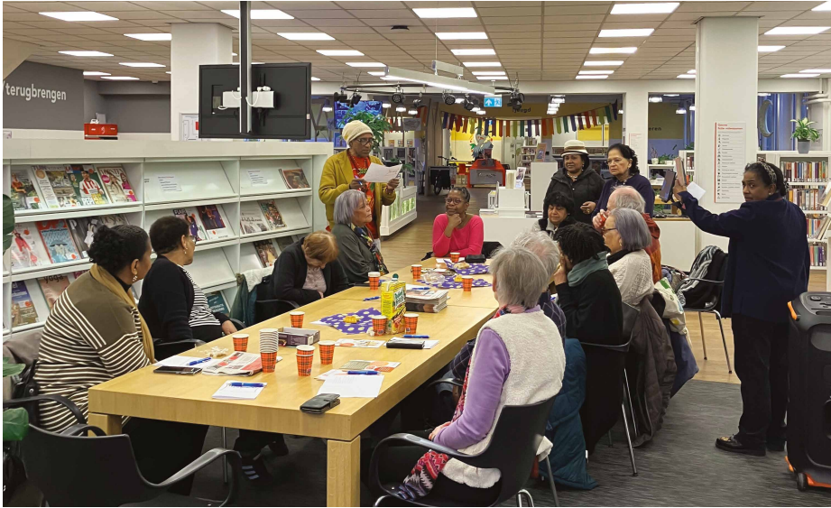
Buurtverhalenvertellers 'Mijn oom Trefossa' op 28 februari 2026 in OBA Reigersbos.